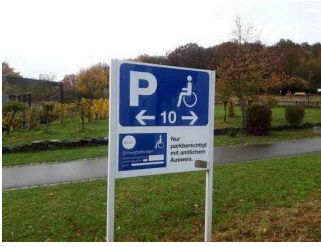
Parkplatz für Menschen mit Behinderungen

Wir haben für Sie einige Fotos aus dem Betrieb / Angebot zusammengestellt. In den Detailberichten finden Sie weitere Fotos.