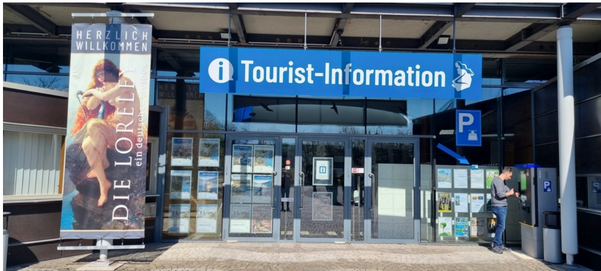
Tourist-Information auf der Loreley