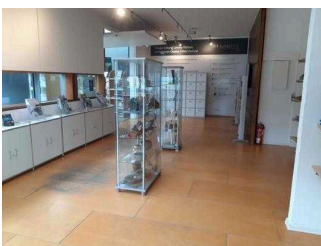
Foyer und Shop