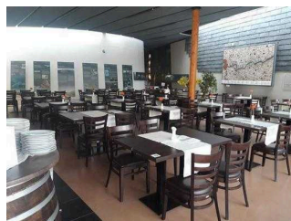
Bistro am Besucherzentrum