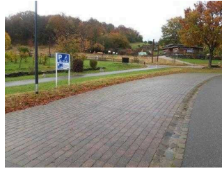
Parkplatz für Menschen mit Behinderungen